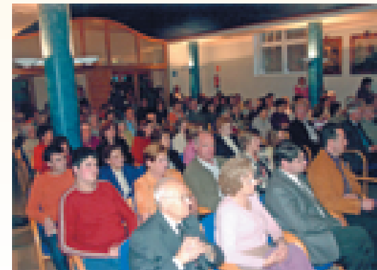
Asistentes a la presentación del libro en Olot.

• "Muy agradecida, Lliberada, por tus favores". Anónimo. (diciembre'07)