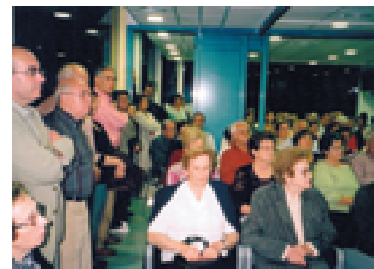
Asistentes a la presentación del libro en Blanes.